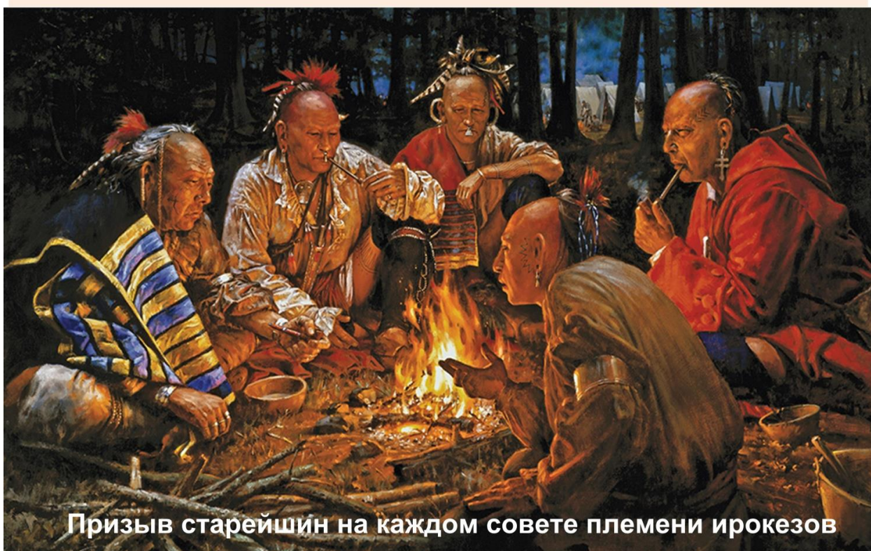
Призыв старейшин на каждом совете племени ирокезов

Возьмемся за дело здесь и сейчас - с надеждой, что принятое нами решение одобряют члены нашего племени, наши потомки в седьмом поколении.